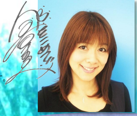
【講師プロフィール】